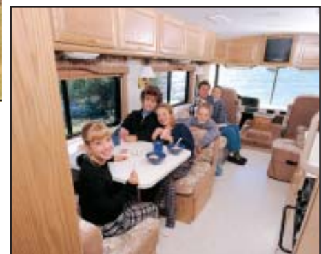
Innenansicht Beispiel A 28-32