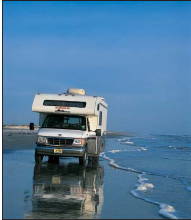
Das ist ein schönes Bild aber das sollen Sie NICHT machen!