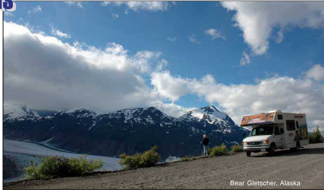
Bear Gletscher, Alaska

Unsere erste Etappe führt uns in Richtung Skagway, der Stadt mit der großen Goldgräbergeschichte. Unterwegs können wir noch die Carcross Dunes, die kleinste Wüste der Welt und den phantastischen Emerald Lake bestaunen. Wer keine Höhenangst hat, wird sicherlich einen Gang über die Suspension Bridge genießen, die in schwindelerregender Höhe den Tutshi River überquert. Gemeinsam oder jeder für sich allein, schauen wir uns die Sehenswürdigkeiten von Skagway an. Abends laden wir Sie zu einem Willkommen Barbecue ein, bei dem wir Gelegenheit haben werden, uns am gemütlichen Campfire genauer kennen zu lernen. (180 km)