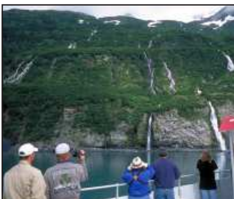
Prince William Sound

Da Valdez in einer Sackgasse liegt, müssen wir wieder zurück nach Glennallen, was bei dieser phantastischen Strecke jedoch kein Problem ist. Am frühen Nachmittag werden wir Lake Louise erreichen, so dass noch genügend Zeit für eine kleine Bootstour, ein erfrischendes Bad im See oder einen entspannten Nachmittag bleibt. (270 km)